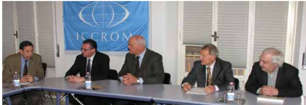
La delegazione del CRAF all'ICCROM

tolineato la scelta di concentrare a Villa Ciani di Lestans il polo formativo sulla disciplina della fotografia (storia, conservazione, catalogazione e restauro), mettendolo a disposizione di iniziative proprie delle istituzioni internazionali. L'attenzione è puntata soprattutto sui laboratori attrezzati per la digitalizzazione e il restauro degli archivi fotografici. Tra le due realtà è emerso il reciproco interesse a collaborare attivamente: in tal senso verrà siglata un'intesa tra le parti. Le prospettive future appaiono interes-